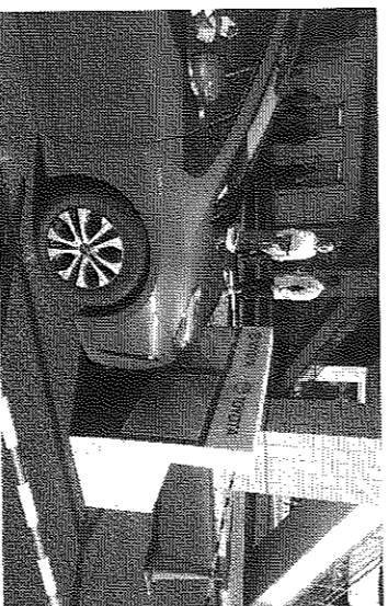
障害物の手前で停止するサポカー